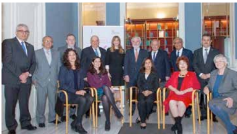
La Comisión interacadémica del DLE.

“Estamos –comentó– en una situación parecida a la de los académicos fundadores: ellos se pusieron como objetivo la realización de un diccionario de la lengua castellana; a nosotros ahora nos toca el reto de hacer el diccionario de los nativos digitales”. Lo más novedoso es que “estará concebido como un libro digital desde su propio origen, aunque eso no descarta que podamos hacer ediciones impresas” agregó.