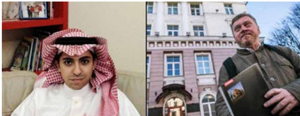
Raif Badawi (izquierda) e Ihar Lohvinau, ganadores del Premio a la Libertad de Edición de la IPA en 2016 y 2014.