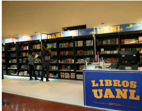
Feria UANLeer 2017.

La escritora Cristina Rivera Garza fue la protagonista principal de la sexta edición de la Feria Internacional de Lectura de Yucatán (Filey), celebrada del 11 al 19 de marzo en la capital del Estado de Yucatán.